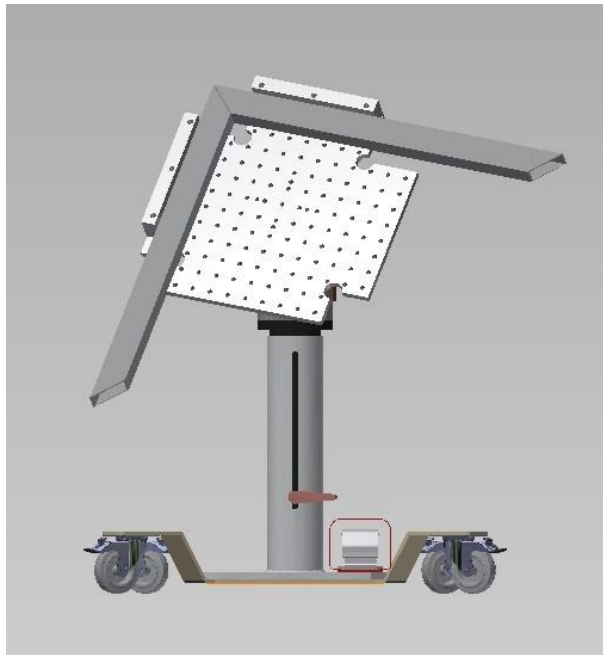
Abbildung 1 Schweißen