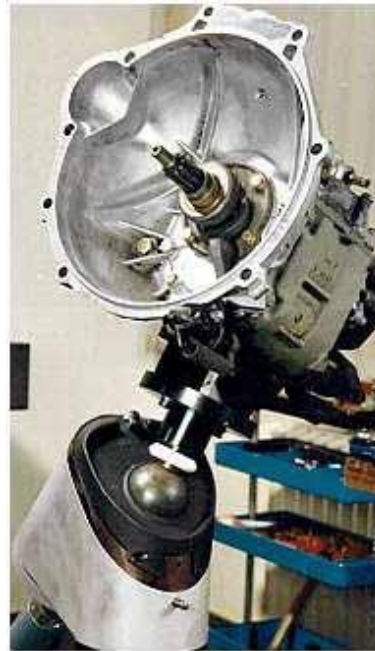
Abbildung 2 montieren