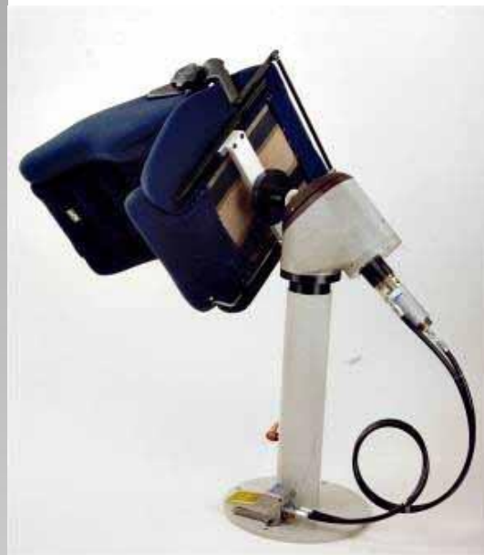
Abbildung 4 Beispiel Sitzmontage Seite 3 von 3

Simon mit Fahrgestell und pneumatischer Höhenverstellung Anwendungsbeispiel Fläche schaben.